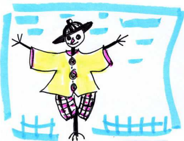
Le sarcloir industriel.