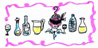
L'Assoiffé du XIIIe.