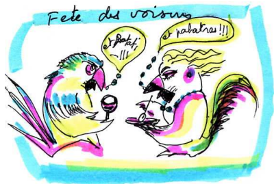
L'Ara qui rit.