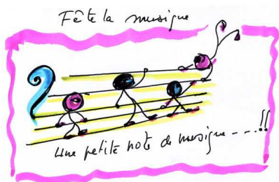
Une petite note de musique ... !!!

Pour en savoir plus sur ♪ ♪ ♪ et ♪ ♪ ♪, appelez le 06 81 88 48 76. ■