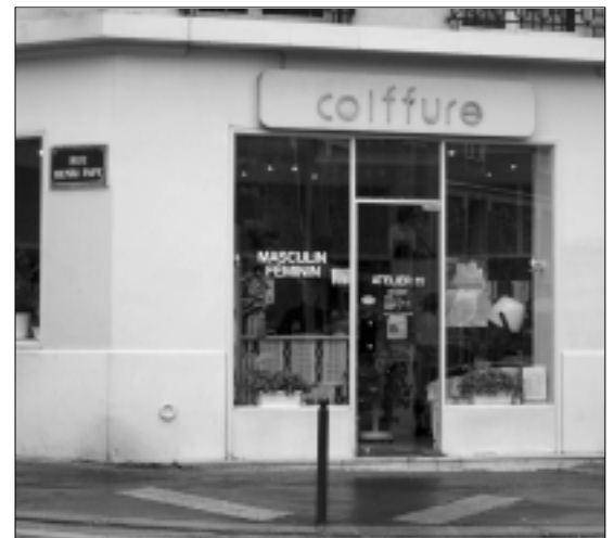
"Chez Odile", haut-lieu des assemblées générales de l'association.

À la fin de l'année 2003, les comptes de l'association affichent un bilan positif, et