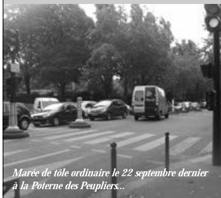
Marée de tôle ordinaire le 22 septembre dernier à la Poterne des Peupliers...